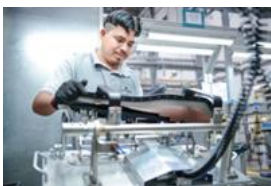
Producția sistemelor de interior