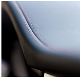
Cusătură ornamentală roșie de interior