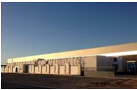
El Jem, Tunisia