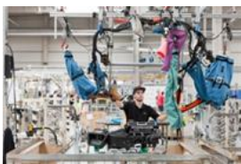
Competență de sistem