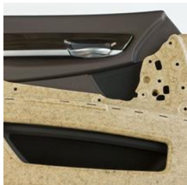
Transportator pentru uși produs din Kenaf