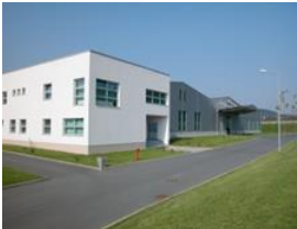
Jelenia Gora, Polonia