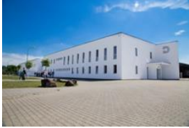
Satu Mare, România