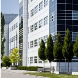
Sediul central în Vilsbiburg, Germania