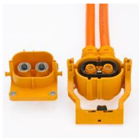
HV Conector pentru aplicații de înaltă tensiune