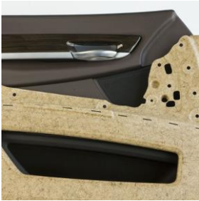
Transportator pentru uși produs din Kenaf