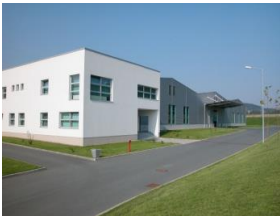
Jelenia Gora, Polonia