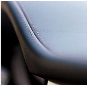
Cusătură ornamentală roșie de interior