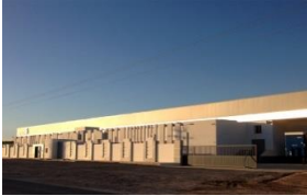
El Jem, Tunisia