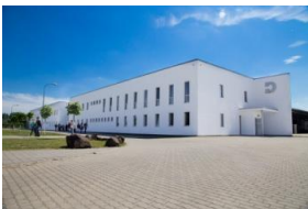
Satu Mare, România