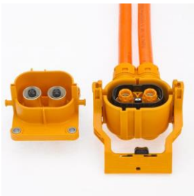
HV Conector pentru aplicații de înaltă tensiune