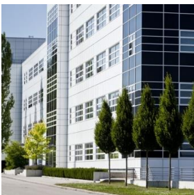
Sediul central în Vilsbiburg, Germania